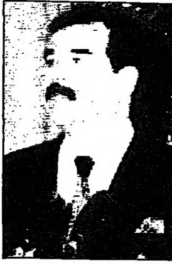
أبي علي الهادي